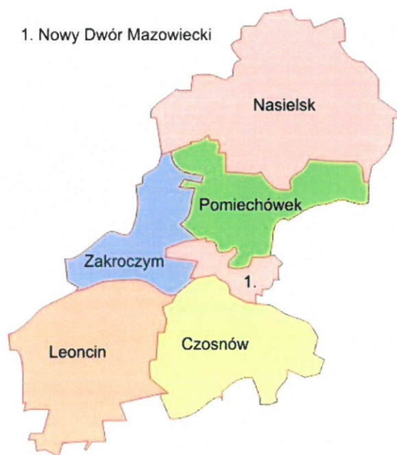
Rysunek 1. Gmina Nasielsk na tle powiatu nowodworskiego

Gmina Nasielsk położona jest w województwie mazowieckim, w powiecie nowodworskim. Oddalona jest od Nowego Dworu Mazowieckiego o około 20 km oraz od Warszawy o około 53 km, dlatego też pozostaje w obszarze bezpośrednich wpływów obu miast (społecznych, ekonomicznych, rekreacyjnych i infrastrukturalnych). W skład gminy wchodzi 65 sołectw, zaś terytorium gminy obejmuje obszar 12,57 km 2 .