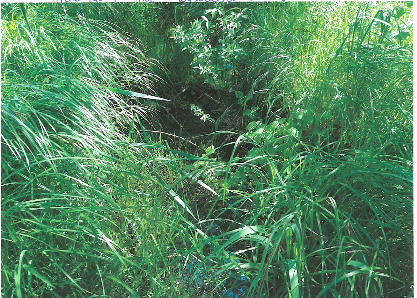
rōw Nr 1 ma vysokū stāvū