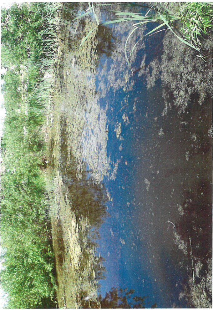
Stare - staw - poblizu kostiole