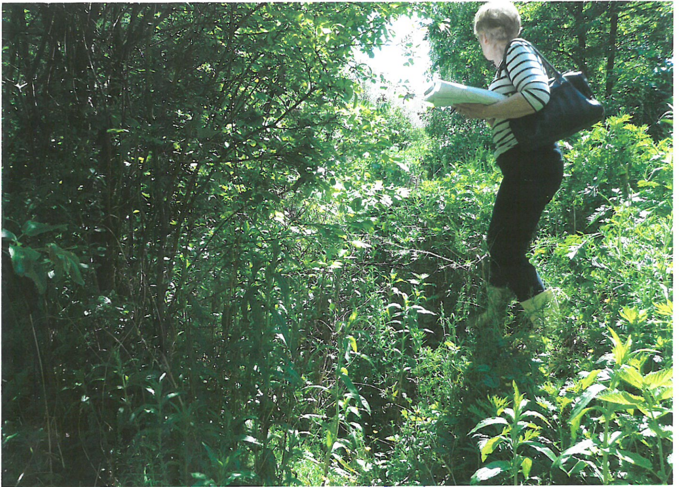
rōw Nr 1 ma wysokū stāvū